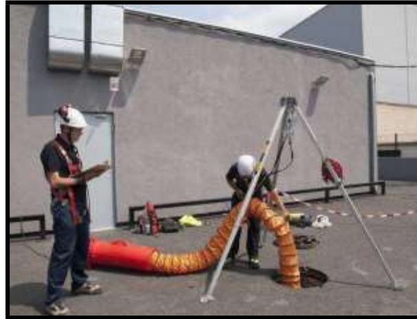
Instalación de un sistema de ventilación

concentración del combustible, en caso de accidente aumenta las posibilidades de supervivencia de las víctimas, aumenta la visibilidad (en casos de polvo, humo o vapores) y por último, acerca la temperatura interior a la del exterior (reduciéndola cuando es muy alta y aumentándola en caso contrario).