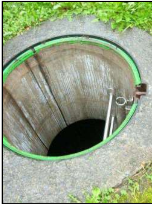
Ejemplo de una abertura limitada

En cuanto a las aberturas limitadas de entrada y salida, el problema radica en definir lo que se considera limitada y lo que no. Se acepta de forma generalizada que dicha limitación no ha de basarse solamente en el tamaño de las mismas, sino que hay que tener en cuenta la dificultad en cuanto al acceso al recinto. De esa manera pueden definirse como confinados, lugares que a pesar de poseer una entrada de gran tamaño, la evacuación del mismo en caso de emergencia puede resultar dificultosa o precisar de mucho tiempo (pozos, galerías profundas...).