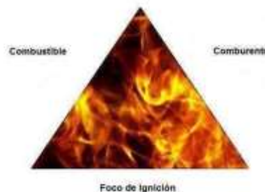
Representación del Triángulo del Fuego

Para que se produzca el fuego es necesaria la presencia simultánea de tres elementos: foco de ignición (o energía de activación), combustible y comburente combinados en la proporción adecuada. De manera que, en caso de desaparecer uno de ellos (o reducirse drásticamente) el fuego se extingue. Esto se representa mediante el llamado "triángulo del fuego" donde será necesaria la presencia de los tres lados del mismo para mantener el proceso de ignición.