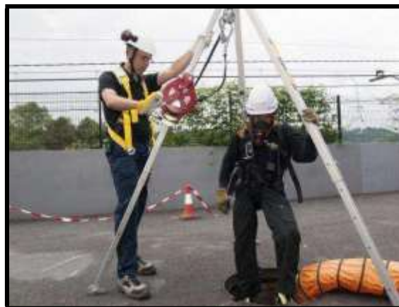
Utilización de un equipo de protección respiratoria para realizar la entrada en un pozo

Antes de realizar una entrada en un recinto confinado habrá que valorar las condiciones y elegir si se van a utilizar este tipo de equipos o no, y cuál de ellos es el más adecuado para el lugar en el que se va a entrar y el trabajo que se va a realizar en él. Todo ello sin olvidar la necesidad de poseer un equipo de protección respiratoria frente a emergencias en la entrada del espacio confinado.