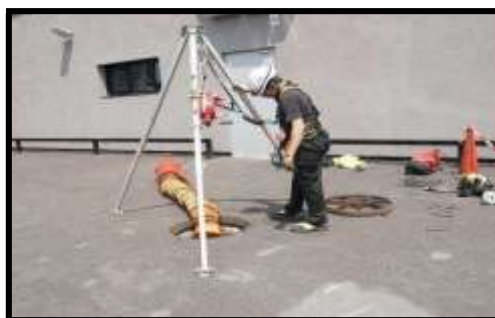
Vigilante en la boca del recinto confinado

Durante el tiempo que los operarios permanezcan en el interior del recinto confinado, alguien deberá cumplir con la labor de vigilancia. Esta labor se encomienda generalmente al recurso preventivo que ha de estar presente obligatoriamente en toda entrada a este tipo de recintos, aunque puede realizarla cualquier otro trabajador. Las funciones de este vigilante serán básicamente el control de la atmósfera interior (cuando sea necesario y así se contemple en el procedimiento de entrada) y sobre todo, asegurar la posibilidad de rescate en caso de ocurrir algún accidente.