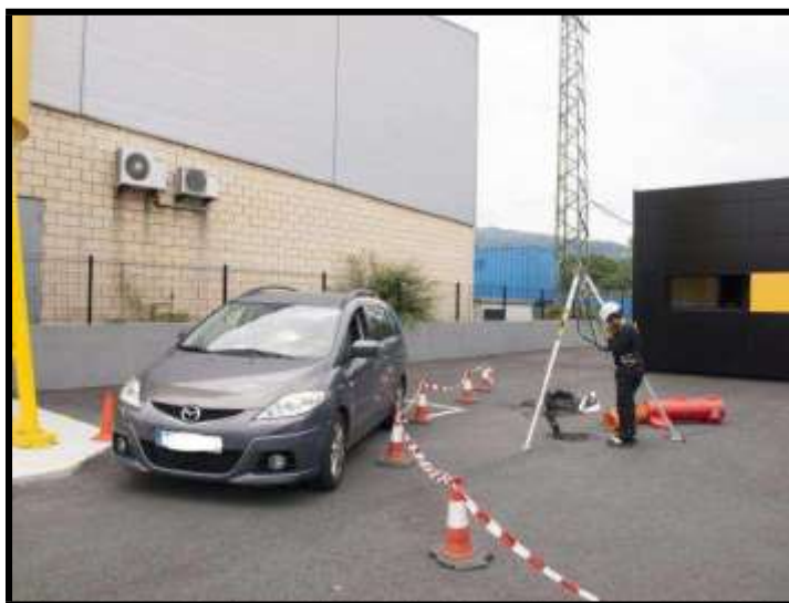
Control y desvío del tráfico rodado junto a un recinto confinado

La señalización de los trabajos se hará de acuerdo con el Real Decreto 485/97 disposiciones mínimas en materia de señalización de seguridad y salud en el trabajo. La utilización de defensas (metálicas y/o textiles) en la boca de entrada constituirá un apoyo a la señalización. En el caso de que la boca de entrada se encuentre en una vía de circulación general, ajena totalmente a la empresa (carreteras de la red viaria dependiente del ministerio de fomento) la señalización de los trabajos deberá regirse por las diferentes instrucciones al respecto editadas por el ministerio de fomento y/o las ordenanzas municipales.