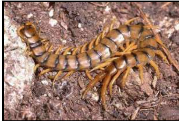
Escolopendra ( scolopendra cingulata )

Entre los miriápodos nos encontramos con las escolopendras o ciempiés ( scolopendra cingulata ), que encuentran en los espacios confinados un hábitat perfecto debido a su ligero nivel de humedad y la ausencia de luz.