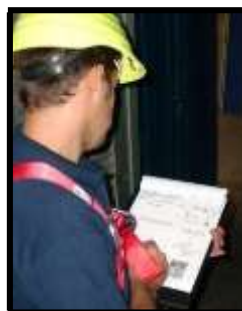
Operario rellenando un permiso de trabajo

En algunos casos puede que estos tres grupos se vean reducidos a dos, siendo quien ordena el trabajo el mismo encargado del grupo que realizará la entrada, o cuando realiza la entrada el propio encargado del grupo.