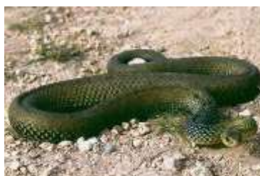
Culebra bastarda y de escalera

Las culebras venenosas (serpiente de Montpellier o bastarda, serpiente coagulla y culebra de agua), no son tan peligrosas como las anteriores, pero también provocarán una dolorosa herida en los afectados.