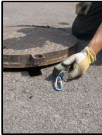
Semiapertura de un recinto confinado

En el caso de que la lectura indicase la presencia de gases en cantidades peligrosas en el interior del recinto, se procederá a la apertura del mismo tras la evacuación de las inmediaciones y provistos de la protección respiratoria adecuada. El recinto podrá entonces ser ventilado, garantizando de esa manera que se dan las condiciones idóneas en el momento de la entrada.