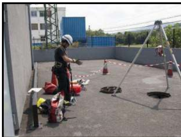
Entrada a un recinto confinado balizado y con el material lejos de la boca de entrada