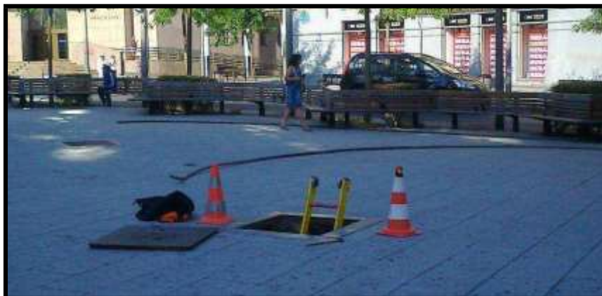
Recinto confinado deficientemente señalizado

La señalización, en todas sus vertientes, es una de las herramientas básicas con las que cuenta la prevención de riesgos laborales para realizar su trabajo. Esta señalización se hará siempre de acuerdo a los criterios y parámetros indicados tanto en el RD 485 como en su guía técnica publicada por el INSHT y en las ordenanzas municipales.