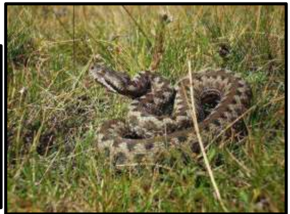
Rata y víbora

Las culebras venenosas (serpiente de Montpellier o bastarda, serpiente coagulla y culebra de agua), no son tan peligrosas como las anteriores, pero también provocarán una dolorosa herida en los afectados.