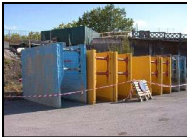
Paneles de entibación

Cuando el recinto confinado se encuentra en lugares abiertos, como es el caso de las zanjas, se utiliza cada vez más, debido a su altísima capacidad de sustentación, la entibación mediante paneles blindados. Se trata de paneles metálicos de diferentes tamaños, unidos dos a dos mediante codales regulables. Existen otros métodos de entibación pero son menos utilizados; paneles con guía de deslizamiento, tablestacas, berlina, paneles con cámara... El problema que suelen presentar estos sistemas y la razón de que solamente se utilicen en lugares abiertos es su gran tamaño y la dificultad, o imposibilidad de introducirlos en la mayoría de los recintos confinados.