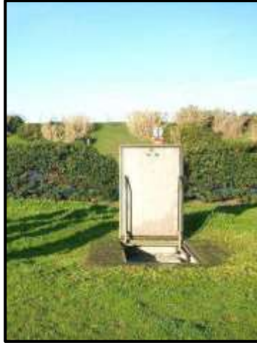
Acceso a un pozo