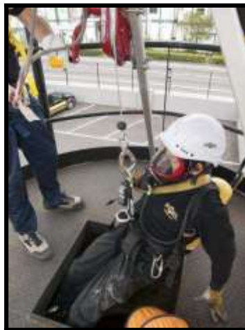
Intervención de rescate utilizando un ERA

Será necesario que las actuaciones estén contempladas de antemano en un plan, conocido por todos los operarios implicados en el trabajo, donde estén reflejadas las medidas de emergencia. De lo contrario, se producirá una "improvisación" de la situación, donde los nervios y las prisas suelen jugar malas pasadas. Las maniobras no se realizarán de manera correcta, generando en la mayoría de los casos, nuevas situaciones de peligro para los accidentados y los encargados de realizar la intervención.