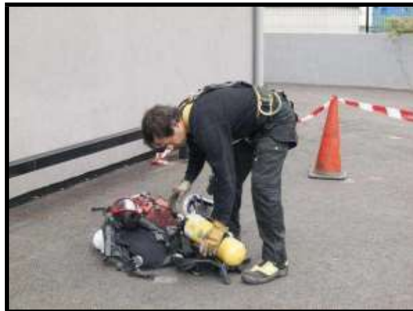
Comprobación del nivel de carga de un ERA

Su función no es tan solo comprobar que se poseen los equipos necesarios para realizar la entrada adecuadamente, sino confirmar que se encuentran en perfecto estado de uso y en condiciones óptimas de funcionamiento (niveles de carga de las baterías, revisiones periódicas, canal en que se encuentran los equipos de comunicación, ausencia de deterioros...). Para ello, los operarios deberán realizar una revisión previa de todos ellos. Esta es la única manera de asegurarse su correcto funcionamiento y de poner en conocimiento de la persona adecuada (generalmente el jefe de grupo) si uno de ellos no funciona correctamente. Esta circunstancia desembocará en su reparación o sustitución antes de comenzar los trabajos.