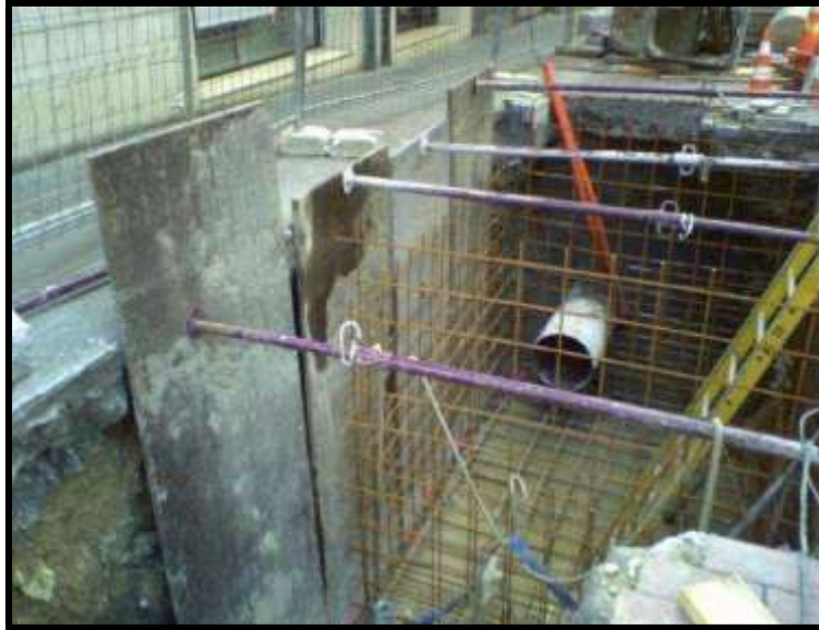
Entibación con planchas de metal

La entibación cuajada se utiliza con materiales menos cohesionados y en ella, se forra toda la superficie susceptible de derrumbarse. Para ello se utilizan también tablonces pero se recurre más habitualmente a las planchas de metal, todo ello sujeto por unos tirantes adecuados.